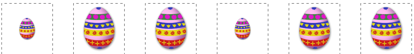
Imagen floral tomada de Openclipart.org